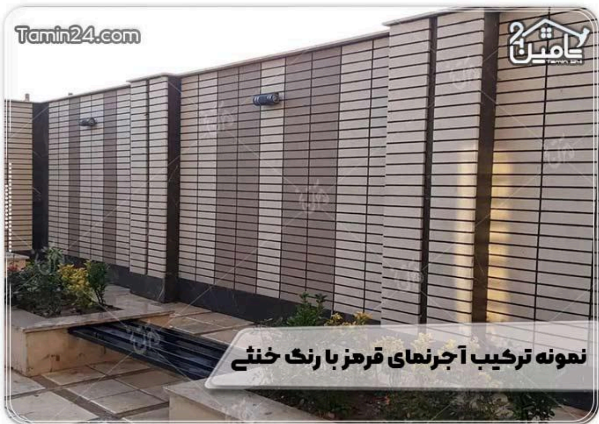
نمونه ترکیب آجرنمای قرمز با رنگ خنثی